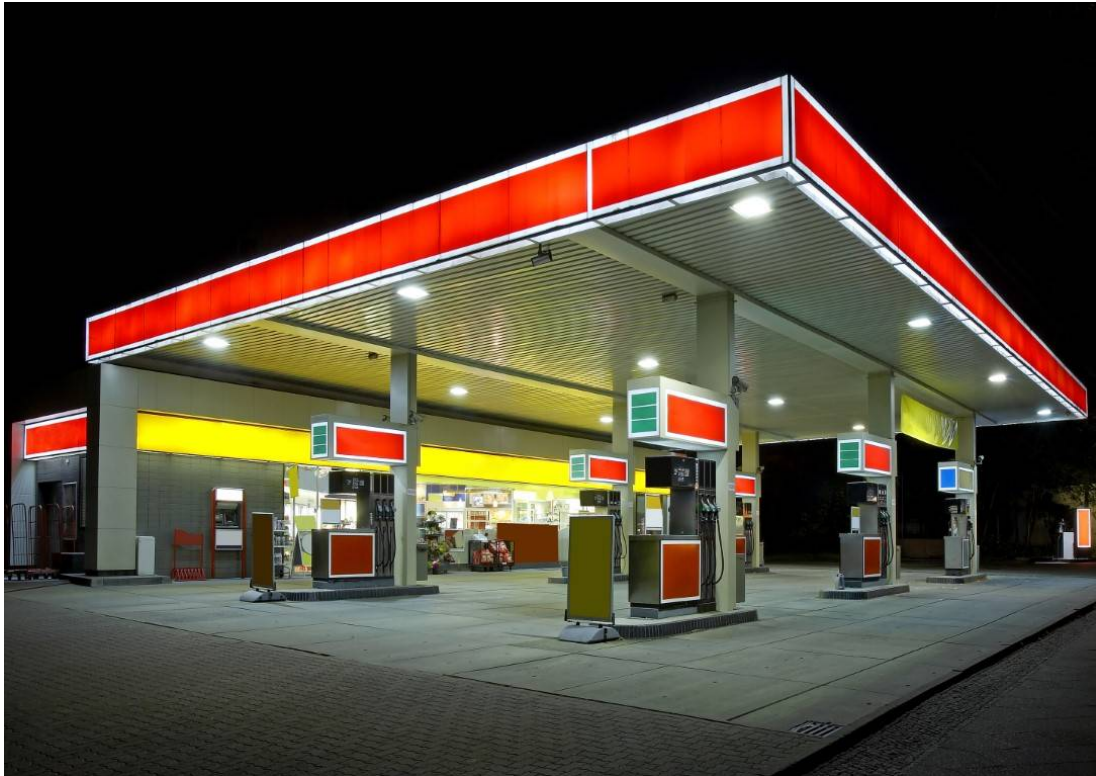
Die Zahl der Tankstellen ging in der Schweiz leicht zurück.

2020 ist die Zahl der Tankstellen in der Schweiz gegenüber 2019 um fünf Anlagen von 3362 auf 3357 gesunken. Die Zahl der Tankstellenshops stieg im gleichen Zeitraum um rund 1,4 Prozent. Während es bei den grossen Shops (mehr als 50 Quadratmeter) zu einer geringen Reduktion um sechs kam, legten die kleinen mit einem Plus von 28 Shops deutlich zu. Dies zeigt die neueste Erhebung von Avenergy Suisse.