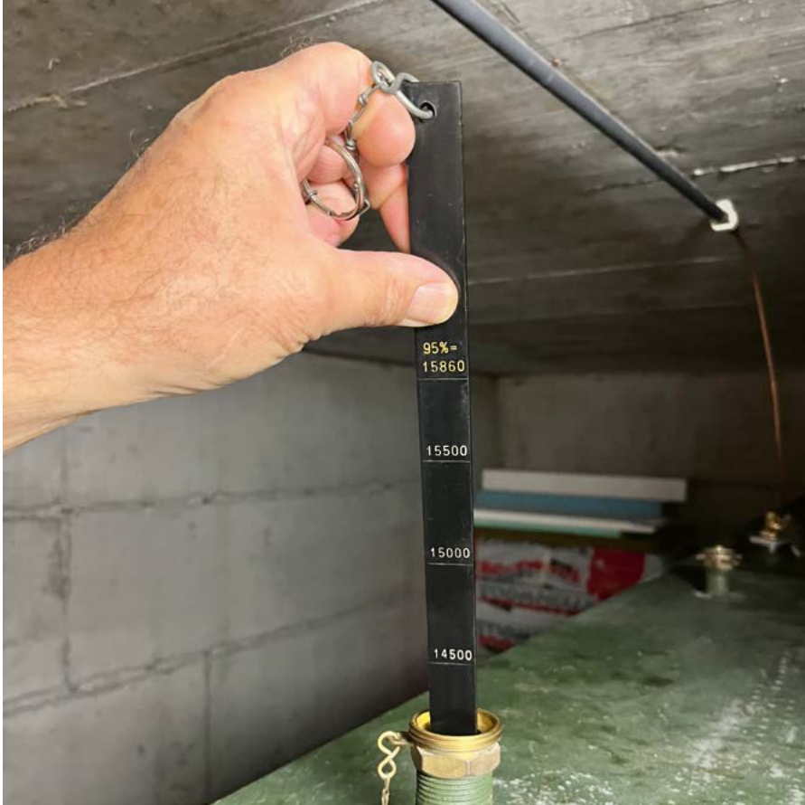
Knapp 16 000 Liter Fassungsvermögen: So einen grossen Tank sieht man selten, vor Allem in einem Einfamilienhaus.

Und so entschied man sich gerade mal 13 Jahre nach dem Neubau, die ungeliebte Elektroheizung zu entsorgen und auf einen deutlich günstigeren Energieträger zu wechseln: Heizöl.